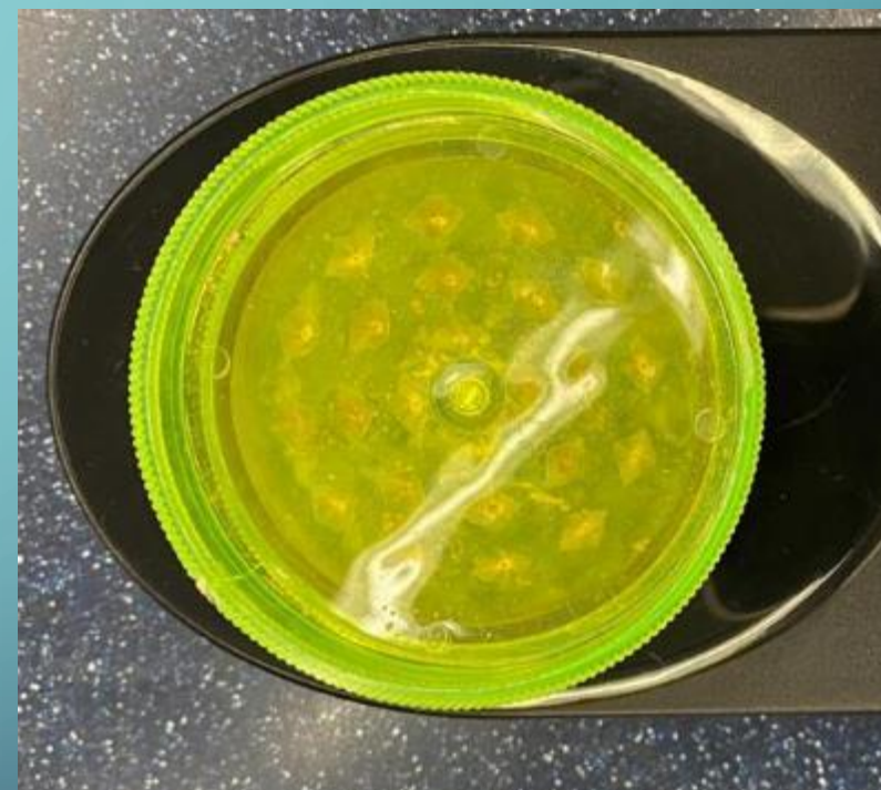
大麻研磨器 / 「草磨」